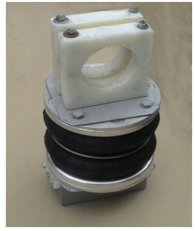
vue fixation essieu