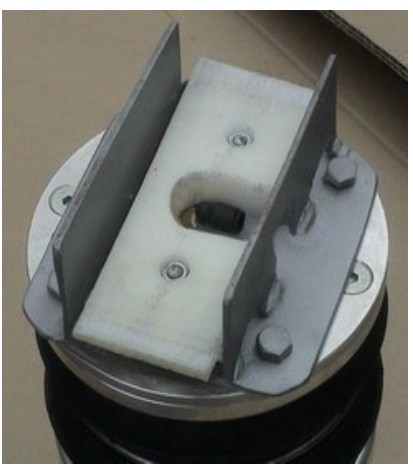
Vue support haut