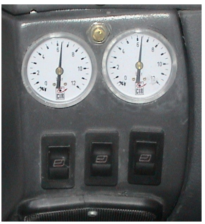
Commandes gauche vidange droite